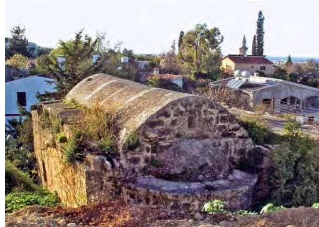
Εκκλησία της Παναγίας Ποταμίτισσας