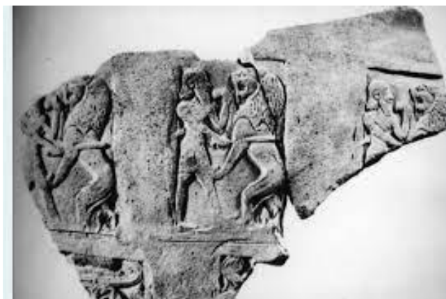
Ευρήματα από τον αρχαιολογικό χώρο στο Καζάφани