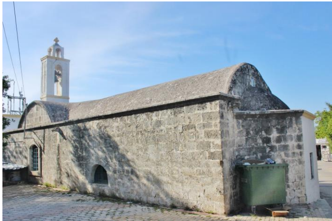
Η εκκλησία Αρχάγγελου Μιχαήλ στο χωριό Καζάφани

Στο χωριό υπάρχει καλά διατηρημένη εκκλησία της Παναγίας του Ποταμού (ή Ποταμίτισσα). Η άλλη εκκλησία του χωριού είναι αφιερωμένη στον αρχάγγελο Μιχαήλ, κι είναι κτίσμα του 18ου αιώνα