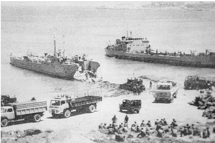
Τούρκοι στρατιώτες αποβιβάζονται στο Πέντε Μίλι

Από τότε το νησί μας είναι σχεδόν μοιρασμένο στα δυο και το χωριό της γιαγιάς και του παππού βρίσκεται στην κατεχόμενη περιοχή της Κύπρου μας.