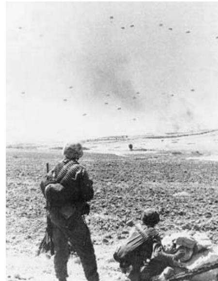
Αλεξιπτωτιστές πέφτουν απ'τον ουρανό σαν τα αρπακτικά πουλιά.